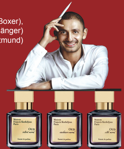
Die Duftpalette: Oud Cashmere Mood, Oud Silk Mood und Oud Velvet Mood

Gustave Eiffel nutzte seine Kreativität und gestaltete für Frapin ein unvergängliches Weinlager.